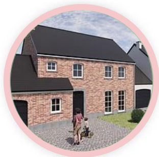
M1 - SYRAH